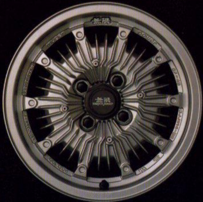
METALLIC SILVER メタリックシルバー

PEARL WHITE METALLIC SILVER GUN METALLIC