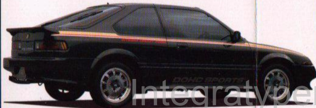
●MUGEN INTEGRA PRO, WHEEL 6J-5(135/50-13)

これ等、闘いの中から得たノウハウとモータースポーツに対する熱い精神が 生み出した無限CF-48。それはオンリーforホンダとして、 まさにベストを約束されるものだ。……………闘いの中から