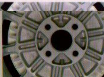
●センターディスク部のムダな部分を取り除き、軽量化を

計ゆえの軽量化に成功した。軽さと剛性の追求はホイール設計の基本。無駄を省いたバネ下重量の軽減が、無限の走りに繋がっている。 ●レース仕様と同開発 無限CF-48は、サーキットから生まれた。'84年より鈴鹿サー