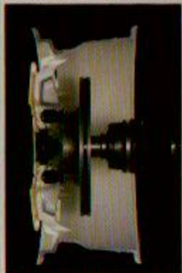
●サスペンション設計のコンセプトに合わせる、オフセット値設定。

無限CF-48は、汎用ホイールにみられるPCDD114.3mmに対する必要寸法をカット。そのため、ホイール内側のセンター部が直径で15mm小型化され、約250gの軽量化につながっている。また、汎用ホイールでは、一輪あたり740kgの荷重想定が必要とされるが、ホンダ車中で一輪あたりの最大荷重を持つのは、アコード2.0Siサルーンの365kgである。CF-48は、このデータをもとに設計されている。汎用ホイールの2/3以下の設定で、充分な強度・剛性マージンをとりつつ専用設