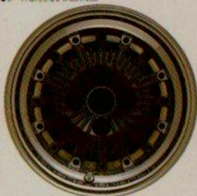
レース専用(N2仕様シティターボII)