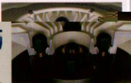
●センターハブとホールの、専用タイプならではのマッチング。

※上記、レース専用ホイールは、スリットは、インナー側の空気抵抗を低減させることにより、又、レース専用ホイールにはオフセットを調整してあります。 ●ホイール・カラー・カンテラック