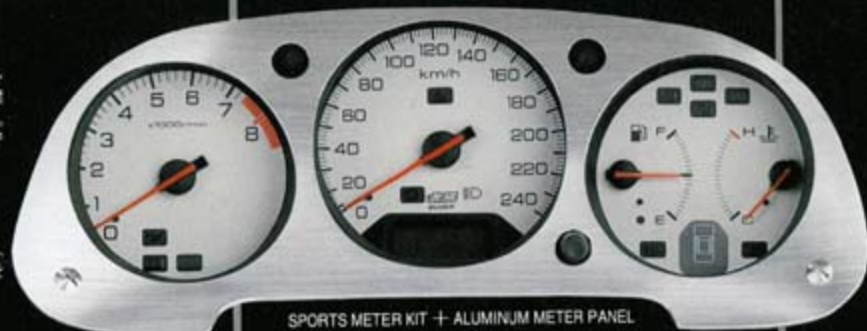
SPORTS METER KIT + ALUMINUM METER PANEL

アルミニウム材を高両重プレスで成型。ヘアライン仕上げとした3眼メーターを包むメーターパネル。