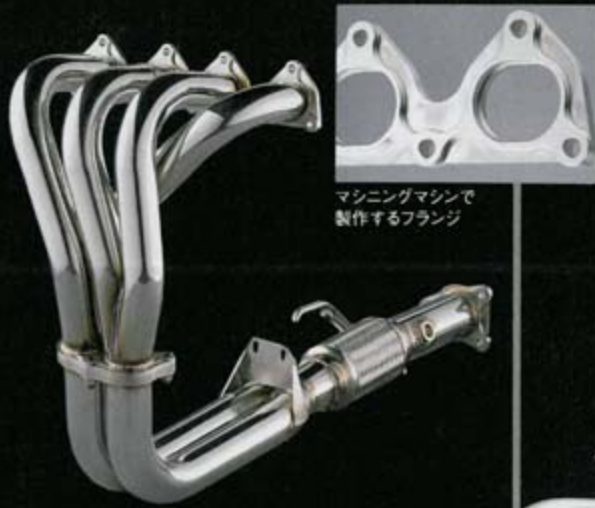
マシニングマシンで 製作するフランジ