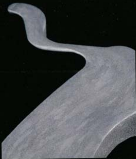
【MF8カット断面】 中央部からリム先端へ続く鍛流線

「摩擦と効き」「鳴きと効き」。これら相反する要素を持ち合わせるブレーキパッド。これらの要素をバランスよく仕上げることがカギとなります。無限は、ハイスピードからの急激なブレーキングにおいても、安定して性能を発揮すること。さらに、その前後ブレーキバランスに注目。フロント、リアの理想的なμ配分、そのための最適なパッド材の調合、設定をしました。耐摩性、耐フェード性に優れ、高温度域での安定した制動力を発揮するノンアスベスト系ゴールドパッド。フロント、リア各々のセットです。摩耗インジゲーターなし。