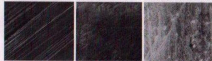
新車 2,500km走行 5,000km走行 (加工面に吸着し、凸凹が平らになっていく様子)