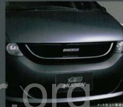
メッキ仕上げ装着例

車体色仕上げ (設定5色 (*) ) ¥35,700 [0.5h] (税抜価格 ¥34,000) 75100-XKD-K0S0-** (無階色記号) メッキ仕上げ ¥37,800 [0.5h] (税抜価格 ¥36,000) 75100-XKD-K0S0-MK 未塗装 ¥28,350 [0.5h] (税抜価格 ¥27,000) 75100-XKD-K0S0-ZZ