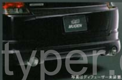
写真はディフューザー未装着。

車体色仕上げ (設定5色 *) ) ¥54,600 [0.5h] (税抜価格 ¥52,000) 84111-XKD-K0S0-** (無階色記号)