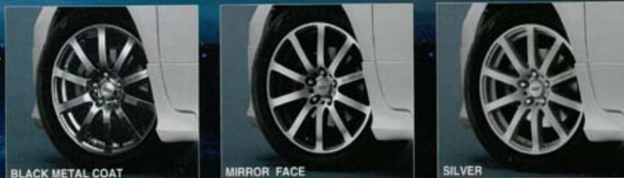
BLACK METAL COAT