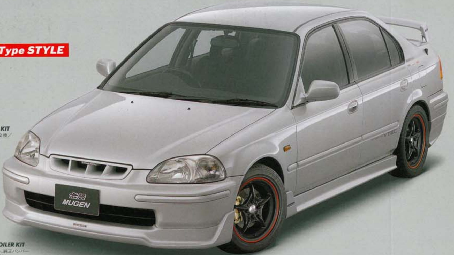
◎ CIVIC FRONT SPORTS GRILLE KIT 競技スタイルスポーツグリル、純正グリルと交換/取付、無限エンブレム付、ABS製。