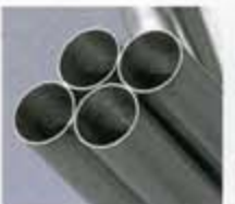
■ ダイヤモンドレイアウト：最低地上高を確保するためのダイヤモンド配置のパイプレイアウト。