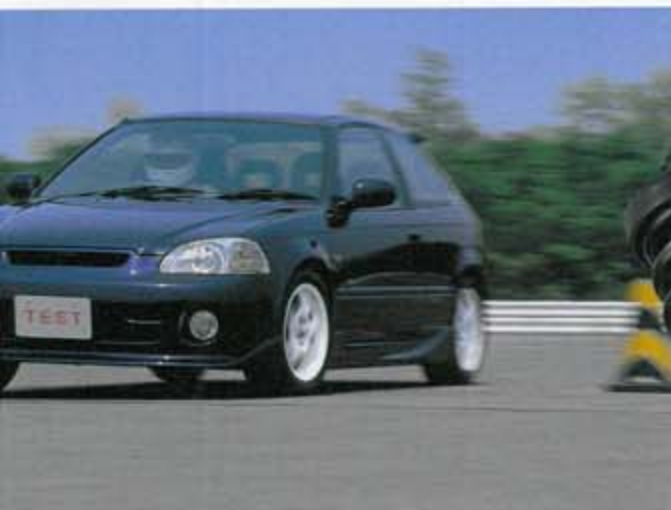
実走評価モードにて何回ものテストが繰り返される。