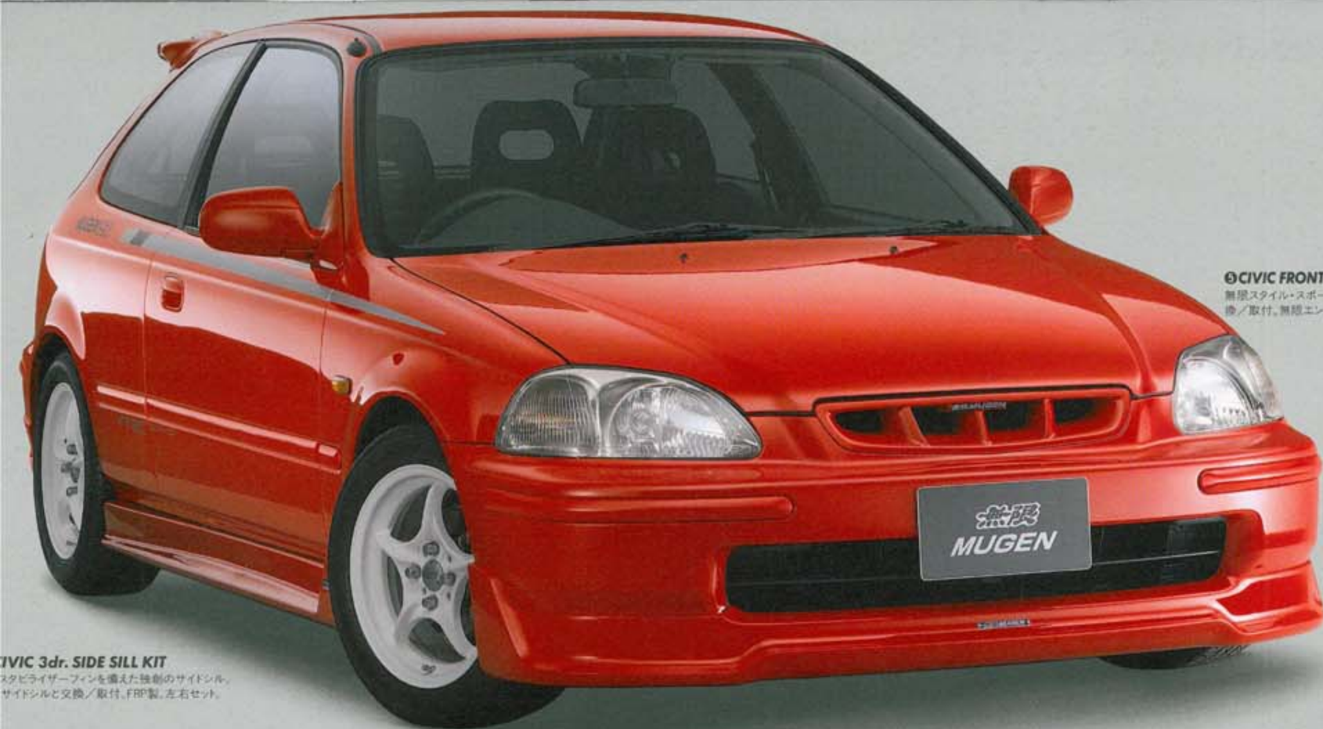
⑤ CIVIC FRONT SPORTS GRILLE KIT

エアアウトレットをデザインに取り込んだリアアerotタイプバンパー。純正バンパーと交換/取付、FRP製、未塗装。