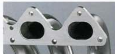
■ フランジ：フルマシニングフランジ+パイプインサート結合によるB16AエンジンのExhaust Portからの結合部段差を排除する。

VTECのHigh-CAM域の性能アップを目標に、試作とテストを繰り返した結果、「4 into 1レイアウト」φ42.7→50.8パイプ径、「そしてある理想的なパイプの長さ」のスペック、そして「パイプインサート+バックシールドガス充填Tig溶接」の手法に行き着いた。但し、このマニホールドが性能を発揮する前提として、そこにはコストや生産性を度外視した製作技法とすることを覚悟しなければならなかった。すなわちフォーミュラエキゾーストと同様、無限スタッフによるハンドメイドの作業工程を必要とした。3ドアSR・フェリオSi(共に5MT)専用、オールステンレス製、保安基準適合、JASMA認定品。