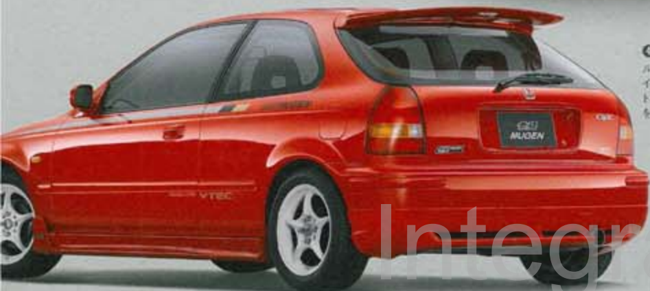
⑧ CIVIC 3dr. REAR UNDER SPOILER KIT

ディフェンダータイプのリアアンダースポイラー。純正バンパー下部取付、FRP製、未塗装。