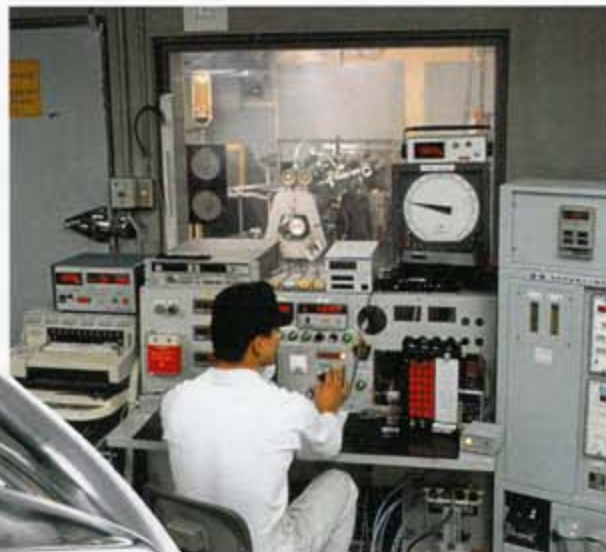
■ ベンチテスト：エンジンベンチテストによる性能確認をし、仕様の詰めを行う。