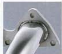
■ 溶接：フランジへインサートされたパイプを外側からTig溶接結合する。