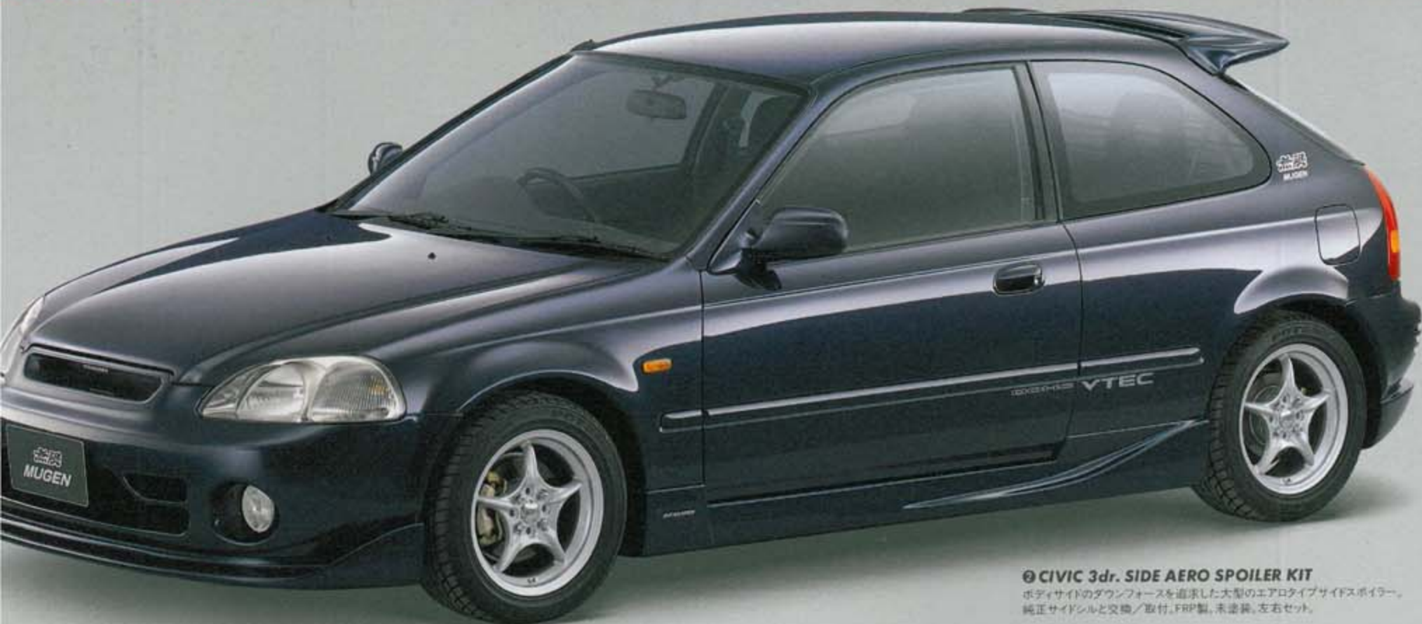
③ CIVIC 3dr. SIDE AERO SPOILER KIT

ボディサイドのダウンフォースを追求した大型のアerotタイプサイドスポイラー。純正サイドシルと交換/取付、FRP製、未塗装、左右セット。