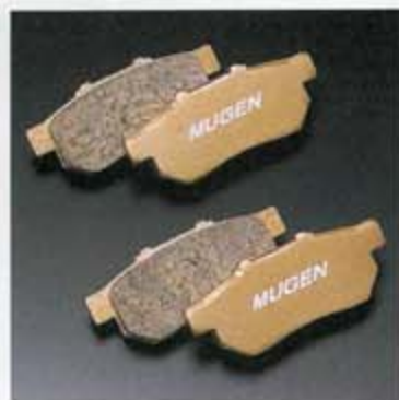
REAR BRAKE PAD SET/REAR

耐フェード性が高く高温域での安定した制動力を発揮するノンアスベスト系ゴールドバッド。フロント、リアアジャスト設定。摩耗インジケータなし。