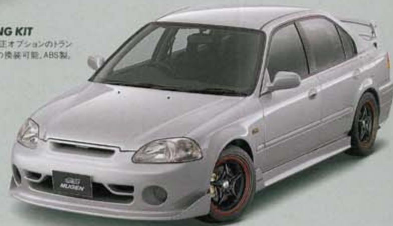
◎ CIVIC FRONT AERO BUMPER KIT サイドフィンを備えたグリル一体型のアロタイプバンパー、純正バンパー、グリルと交換/取付、FRP製、未塗装、3ドア/フェリオ用、フォグランプは別売(CIIE VISAGE II)。 バンパー裏面のクワット内にはバンキングアーム(ブラック)仕上げが標準仕様となります。