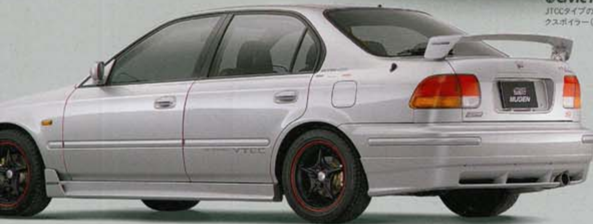
◎ CIVIC FERIO REAR WING KIT JTCCタイプのウイングスポイラー、純正オプションのトランクスポイラー(ハイウイングタイプ)との換装可能、ABS製。