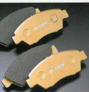
FRONT BRAKE PAD SET/FRONT