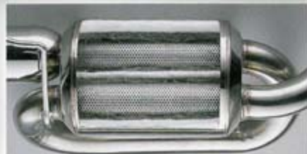
消音の「吸収」「干渉」という要素を積極活用する。パイプのループレイアウトとサイレンサー内のパイプのストレート化にこだわった内燃器構造。