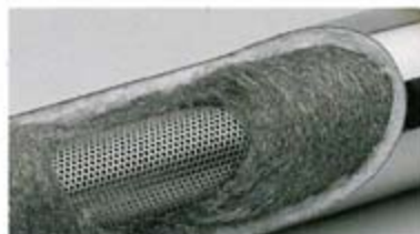
その吸音材にレーシングサイレンサー同様の耐熱金属材を採用する中間サイレンサー。

エキゾーストマニホールドキット/スポーツエキゾーストシステムにセットされる専用メタルステッカー。単品販売はありません。