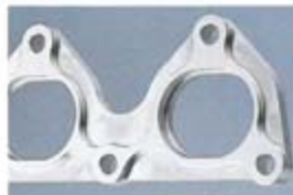
マシニングマシンで製作するフランジ