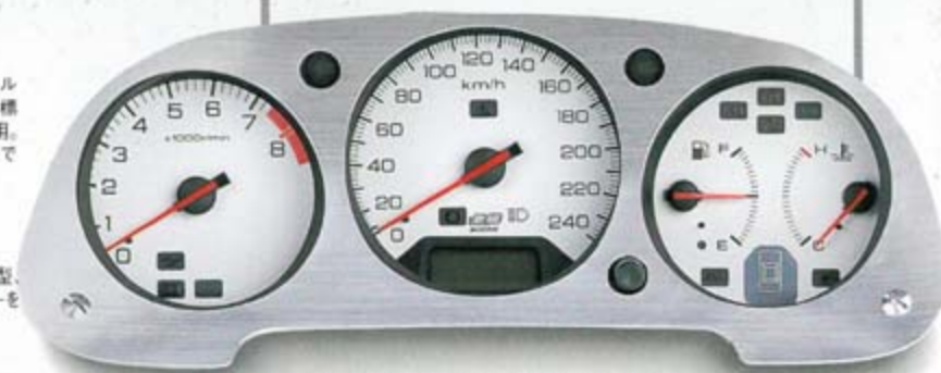
SPORTS METER KIT + ALUMINUM METER PANEL

アルミニウム材を高荷重プレスで成型、ヘアライン仕上げとした3眼メーターを包むメーターパネル。