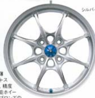
シルバーメタリック