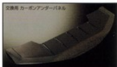
交換用 カーボンアンダーパネル