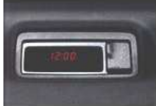
デジタルクロック