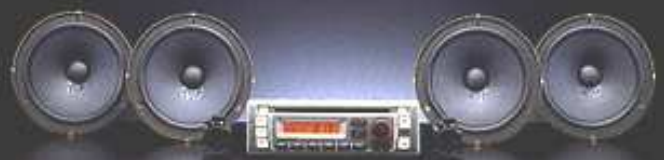
AM/FM電子チューナー・6CDステレオ+6スピーカー 透明窓あふれるデジタルサウンドを奏でるCDプレーヤー さらに、6スピーカーにより迫力のサウンドが楽しめる。