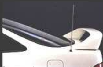
オートアンテナ ラジオのスイッチのオン・オフに連動し、 自動的に伸縮するアンテナ