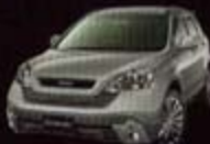
ウィスラーシルバー・メタリック (NH711M) WB