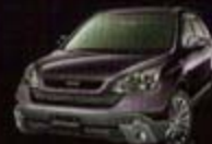
ブラックアメリスト・パール (RP37P) BA