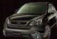
ナイトネーフブラック・パール (B02P) NB