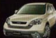
ゴロゴベージュ・メタリック (YR566M) OB