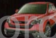
ダークルビーレッド・パール (R1525P) DR