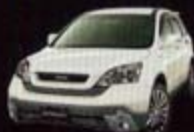
プレミアムホワイト・パール (NH624P) PW