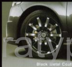
Black Metal Coat