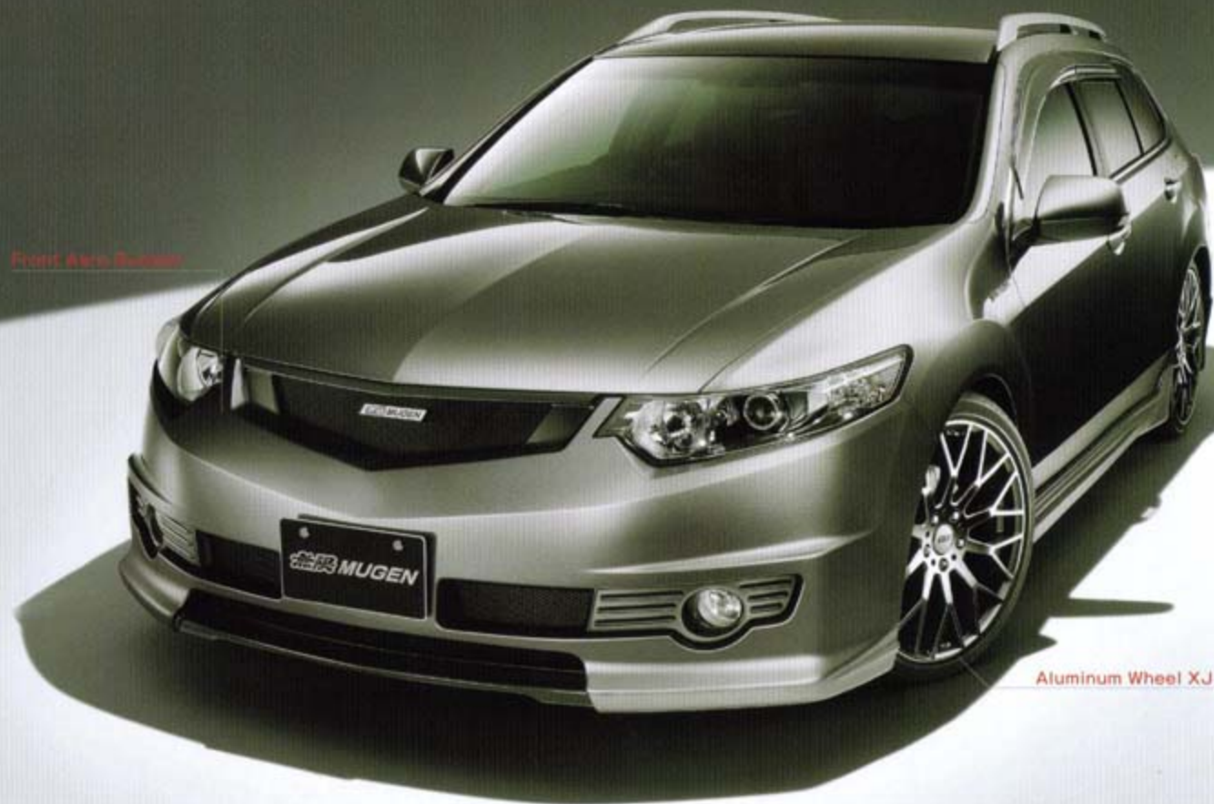
Aluminum Wheel XJ