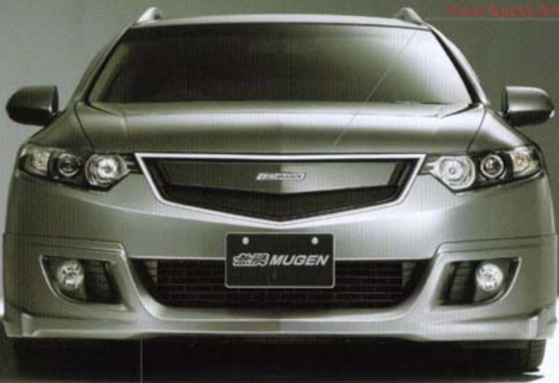
Front Under Spoiler