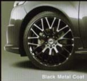
Black Metal Coat

Black 18×7½J+55 ¥44,100/1本 (0.7h) (税抜価格¥42,000) 42700-NR5-875K-55