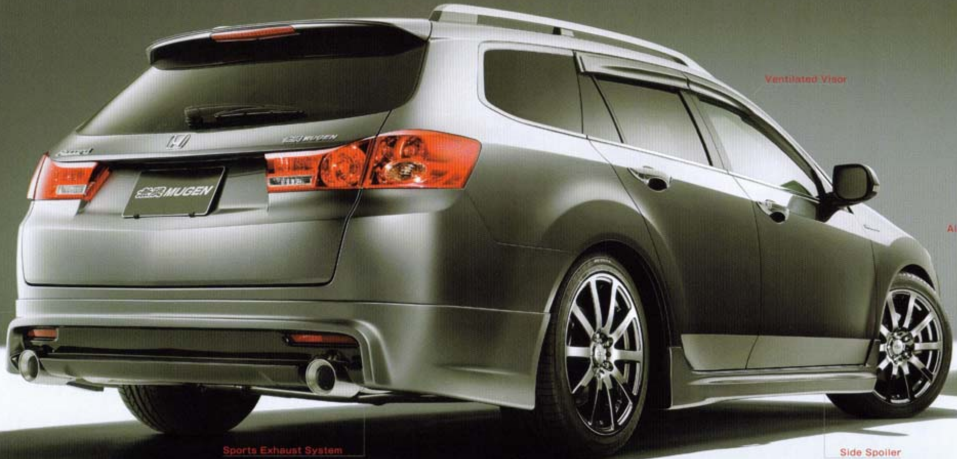
Rear Under Spoiler