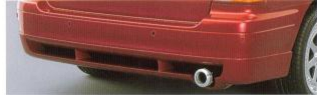
⑤ REAR UNDER SPOILER KIT リアビューを印象づけるリアアンダースポイラー。グラスファイバー製。未塗装。