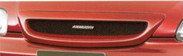
① FRONT SPORTS GRILLE KIT スポーティなブラックメッシュグリル。無限エンブレム付。カーボンファイバーとガラスファイバーのハイブリッド(複合構成)。未塗装。