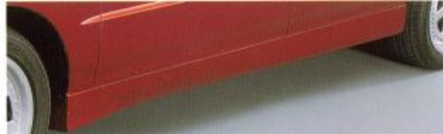
③ SIDE STEP KIT 車高を低く魅せ、ボトムラインをスタイリッシュに引き締めるサイドステップ。サイドシルガーニッシュと交換する。グラスファイバー製。R/Lセット。未塗装。