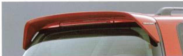
④ AIR SPOILER KIT ルーフエンドへ装着する、ウイングイメージのエアスポイラー。グラスファイバー製。未塗装。