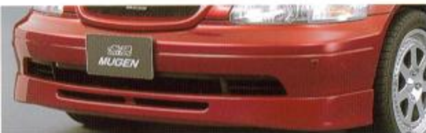
② FRONT UNDER SPOILER KIT フロントマスクを精悍かつスポーティにするスポイラー。バンパー下部へかぶせて装着する。グラスファイバー製。未塗装。