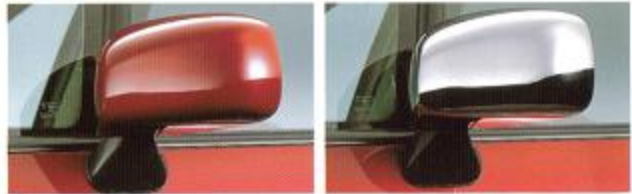
⑥⑦ AERO MIRROR VISOR KIT エアロダイナミクスイメージのドアミラーバイザー。ドアミラーへかぶせて装着する。各車体色塗装仕上げとメッキ仕上げを用意。

※17ミラーの格納機能を妨げることはありません。また、ドアミラー調整時、全幅(左右ドアミラー外寸の距離)が若干増えます。