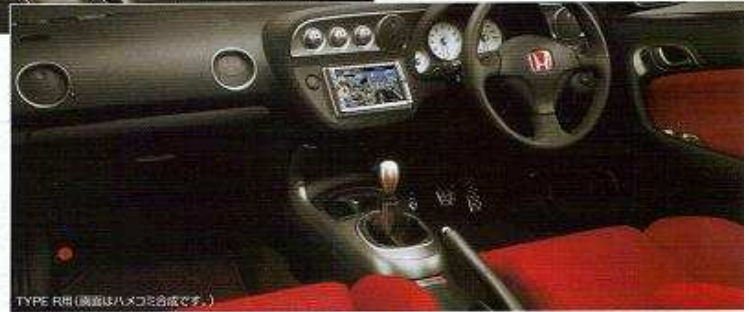
TYPE R用 (調音はハメコに合成です。)