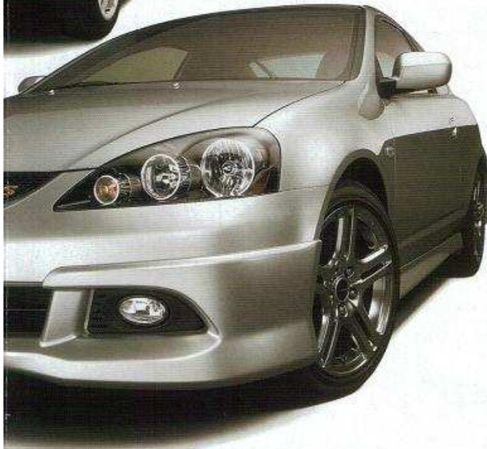
TYPE S用 (調音はハメコに合成です。)