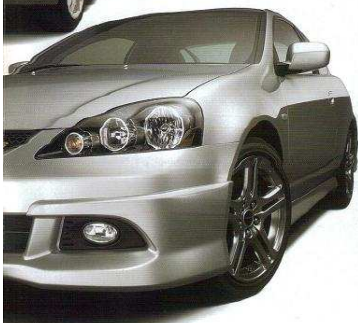
TYPE S用 (画像はハメコメ合成です。)