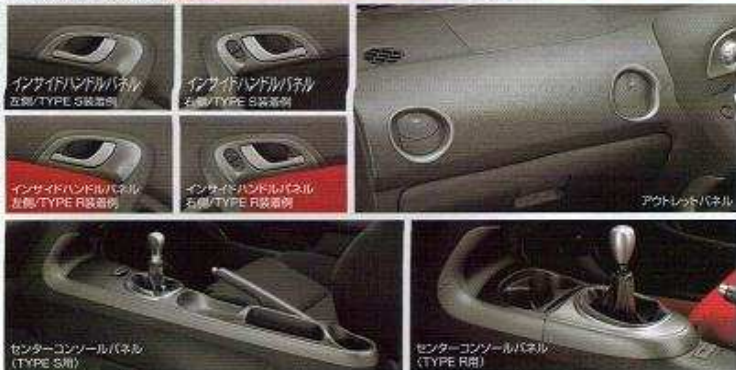
インテリアパネル (チタン調ヘアライン/インサイドハンドルパネル(左側)+アウトレットパネル(左側)+センターコンソールパネル(左側)) ●TYPE S用 ¥25,200 (0.4H) (消費税¥24,000) ●TYPE R用 ¥23,100 (0.4H) (消費税¥22,000)