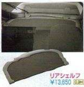
リアシェルフ ¥13,650 (0.3H) (消費税¥13,000)