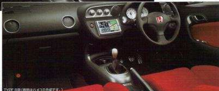
TYPE R用 (画像はハメコメ合成です。)